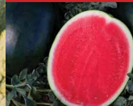
MAGNÉLKÜLI, FEKETE HÉJÚ Stellar F1