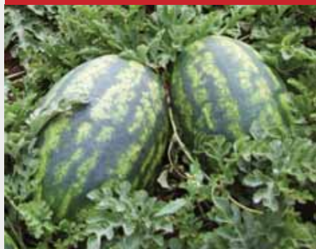
OVÁLIS, CSÍKOS HÉJÚ Lady F1