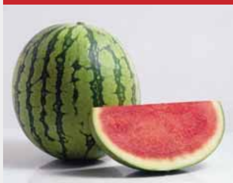
MAGNÉLKÜLI, CSÍKOS HÉJÚ Boston F1