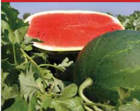
OVÁLIS, CSÍKOS HÉJÚ Caravan F1