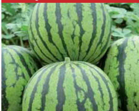
MAGNÉLKÜLI, CSÍKOS HÉJÚ Bonny F1