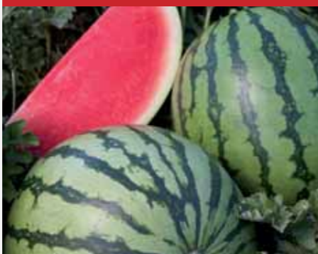
MAGNÉLKÜLI, CSÍKOS HÉJÚ Estel Deluxe F1