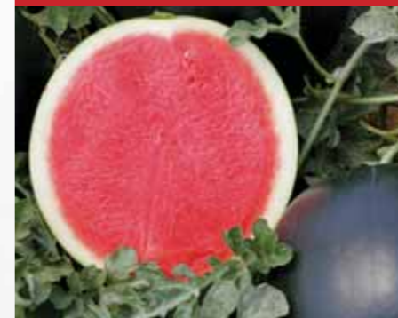
MAGNÉLKÜLI, FEKETE HÉJÚ Valdoria F1