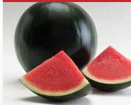
MAGNÉLKÜLI, FEKETE HÉJÚ Style F1